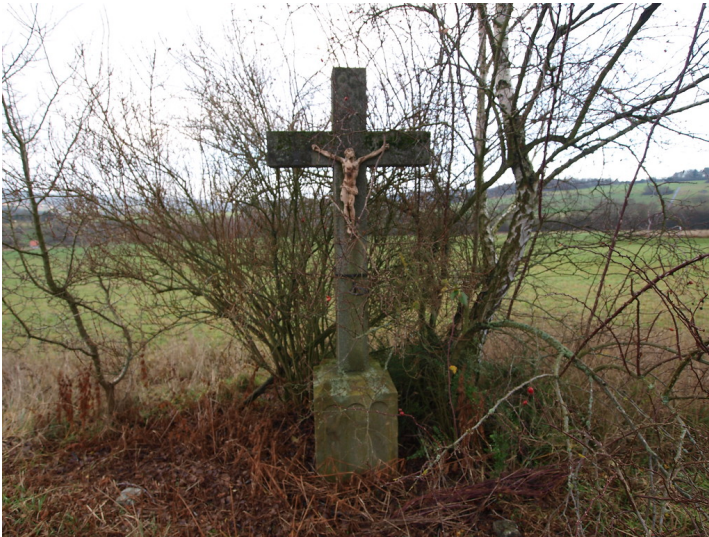
Mays Kreuz bei Seibersbach (2015)