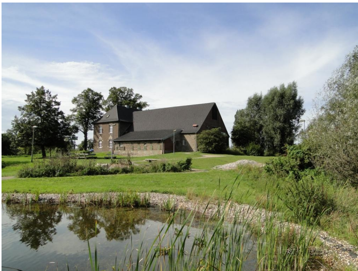
Außenansicht des Natur- und Umweltbildungszentrum Wahrsmannshof bei Rees mit Untersuchungsteich im Vordergrund (2011).