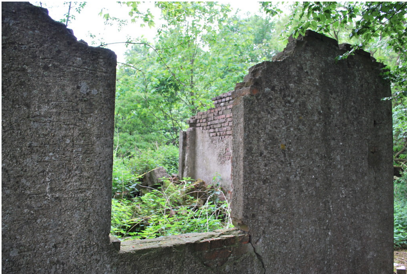
Überreste der Funkstation Köln-Esch (2015).