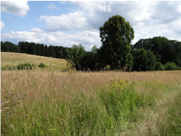
Blick vom Feldweg auf eine artenreiche Wiese östlich der untergegangenen Ortschaft Kahlenberg (2015)