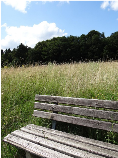
Ruhebank direkt an einer artenreichen Wiese am Kahlenberg bei Kürten (2015)