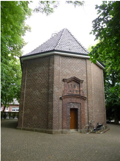
Evangelische Kirche in Rees-Haldern (2015).