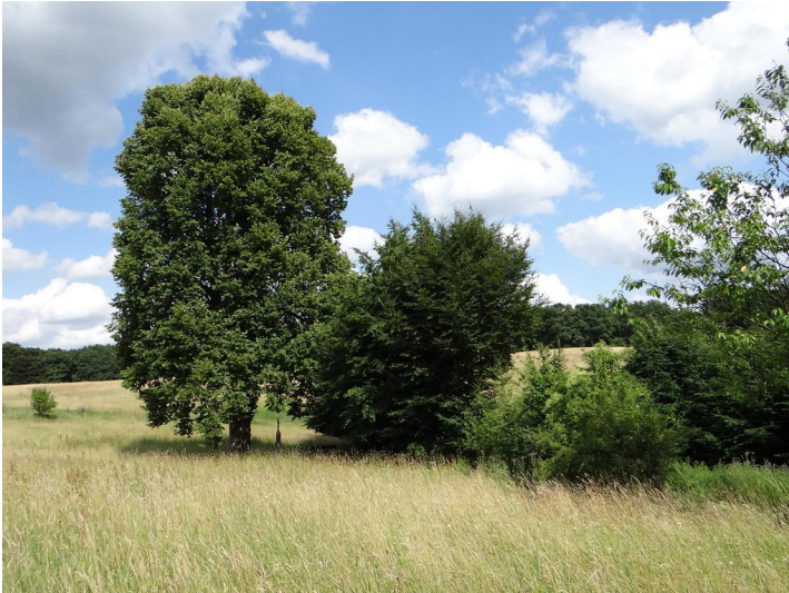
Ehemalige Ortschaft Kahlenberg mit Naturdenkmal alte Linde, nördlich Burgheim bei Kürten (2015).