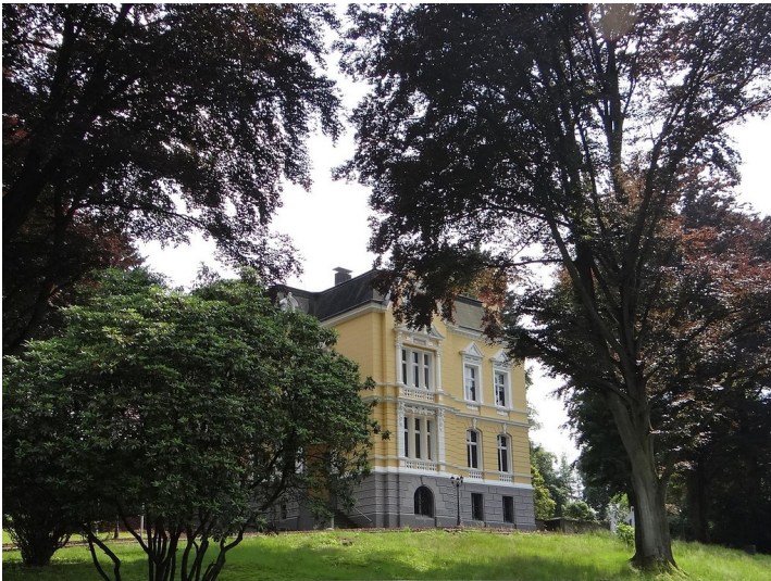
Villa Dörrenberg (2013)