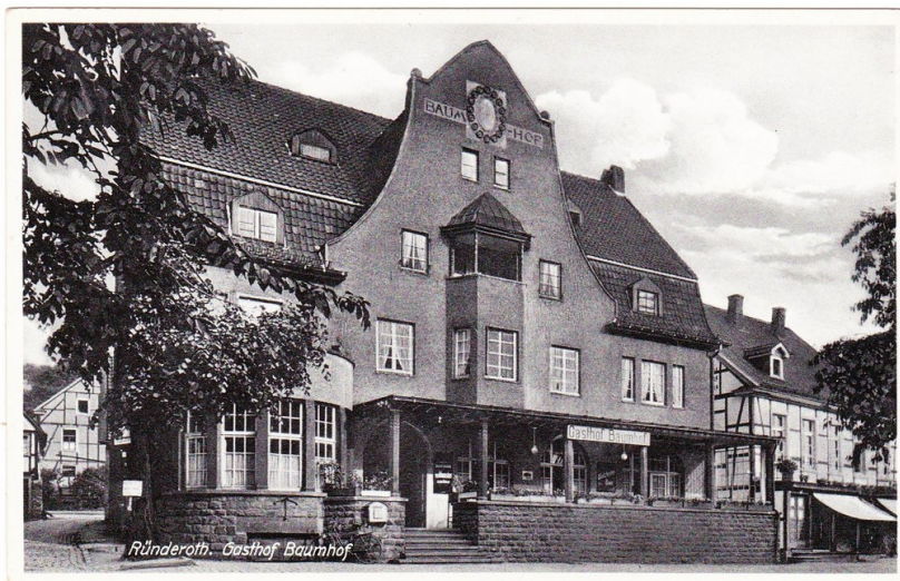
Gasthof Baumhof in Runderoth