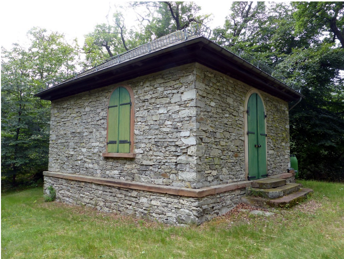
Südostansicht der Gretingsburg westlich von Dörrebach