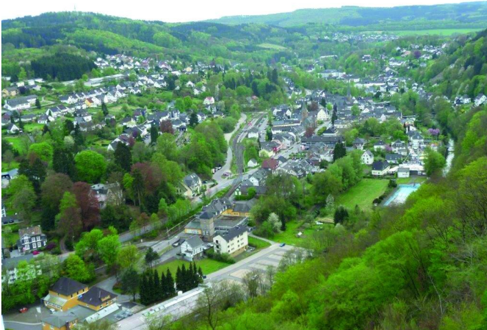
Ausblick vom Haldyrturm nach Süden auf die Ortschaft Engelskirchen-Ränderoth (2004).