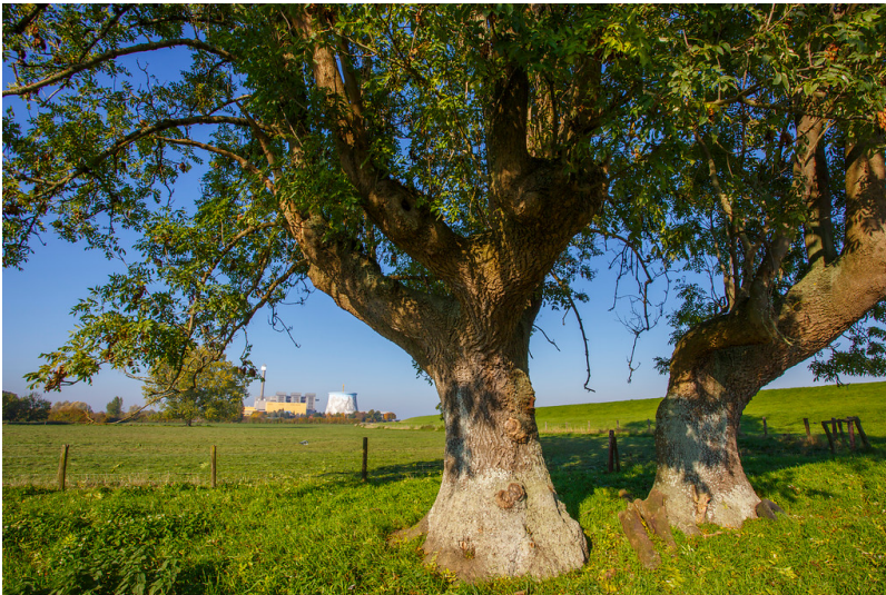
Durchgewachsene Kopfeschen am Deich bei Hönnepele (2015)