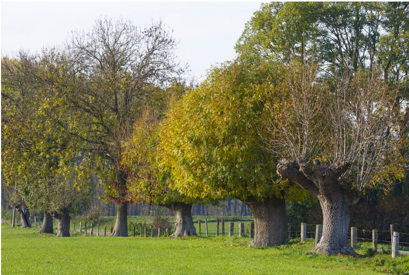
Drei Kopfeschen im Herbstlaub bei Rees-Grietherbusch (2015)