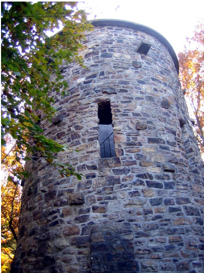
Steckenberg-Turm im Neuenahrer Wald (2015)