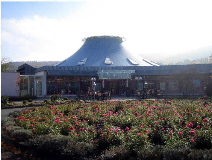
Der Eingangsbereich der Ahr-Thermen in Bad Neuenahr (2015).