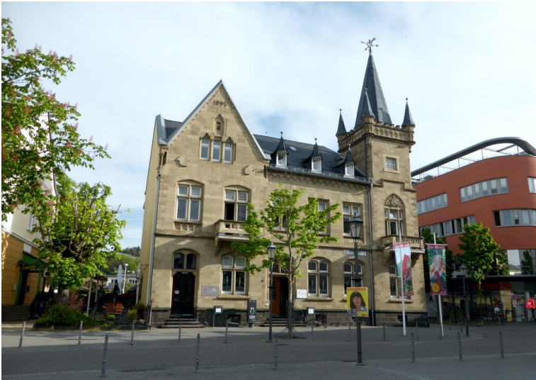
Altes Rathaus in Bad Neuenahr (2019)