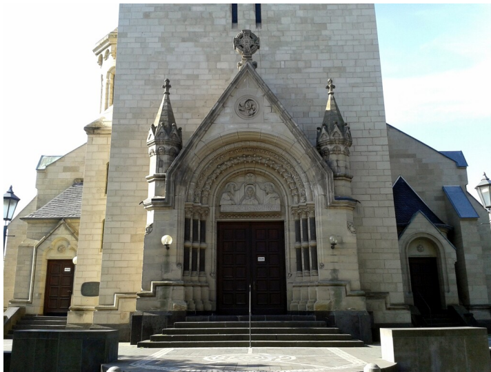
Rosenkranzkirche Bad Neuenahr (2015)