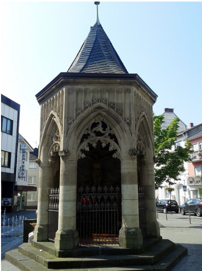
Kapelle am Alten Markt Bad Neuenahr (2016), Ansicht von Norden.