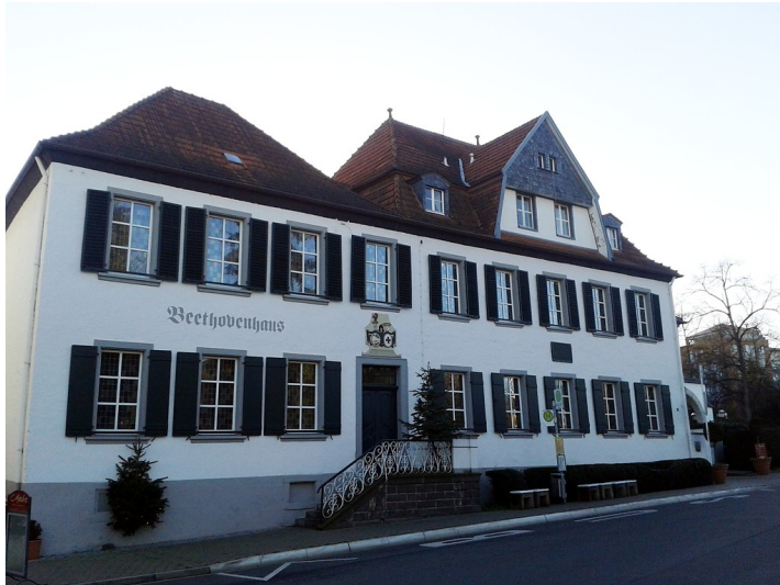
Beethovenhaus in Bad Neuenahr (2016)