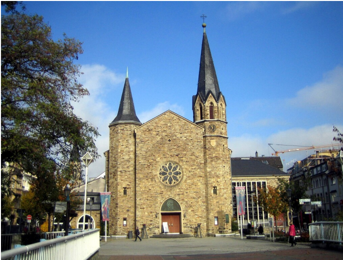
Martin-Luther Kirche in Bad Neuenahr (2015)