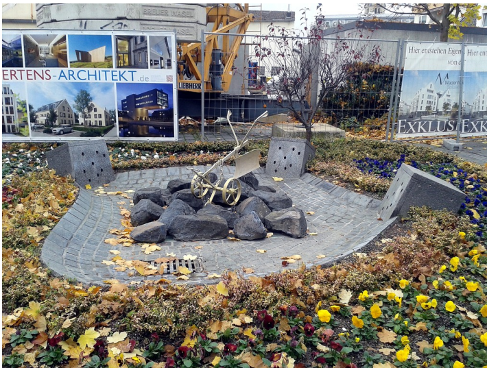
Die Brunnenanlage "Goldener Pflug" auf dem Wadenheimer Platz in Bad Neuenahr, Frontansicht von der Jesuitenstraße aus (2016).