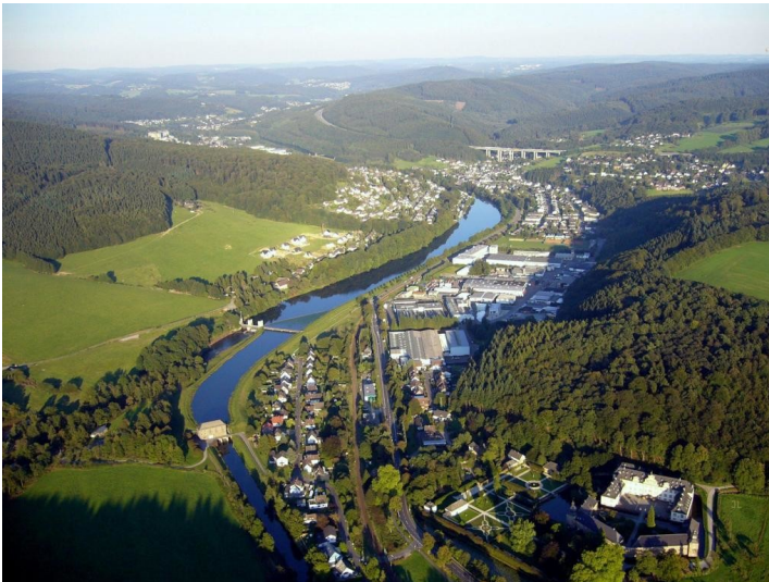
Luftbildaufnahme des Ortsteils Engelskirchen-Loope (2005)