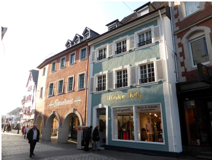
Haus Geschier in Ahrweiler (2018)