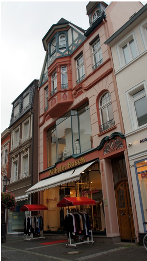
Das Jugendstilhaus "Wilhelm Busch" in Ahrweiler (2015).