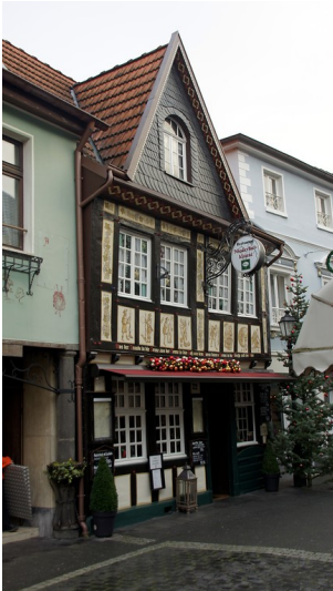
Niederhutklausen in Ahrweiler (2015).