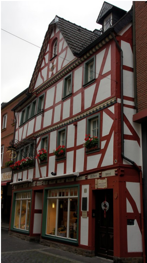
Haus Heinrichs in Ahrweiler (2015), Gesamtansicht von Osten.