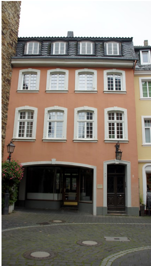
Haus Kreutzberg in Ahrweiler (2016).