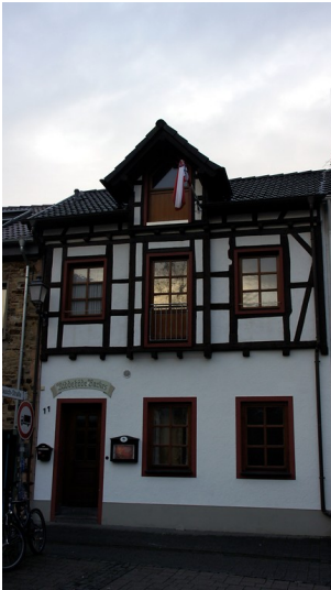
Backhaus der Niederhut in Ahrweiler (2016)