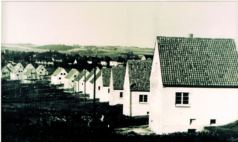
Kurz vor der Fertigstellung 1938

Siedlung Maikammer 1938