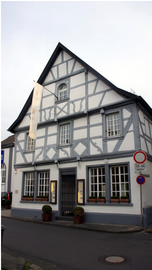
Außenansicht des alten Zunfthauses in Ahrweiler (2015)