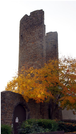
Bitzenturm der Stadtbefestigung Ahrweiler (2015)