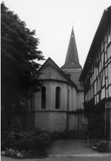
Katholische Pfarrkirche Sankt Maximinus in Düssel (1978)