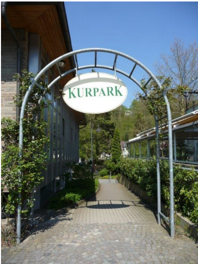
Eingang zum Kurpark Runderoth