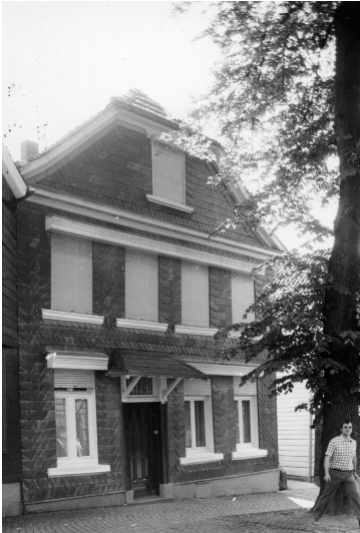
Haus Die Glocke, Kirchplatz 4 in Wülfrath (1978)