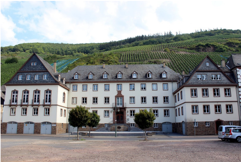
Frontansicht des Finanzamtes in Zell an der Mosel (2015)