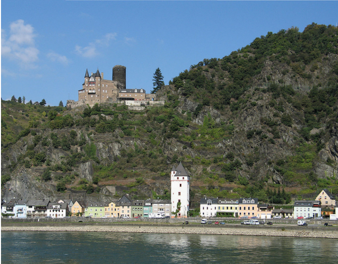
Burg Katz oberhalb von Sankt Goarshausen mit dem "Eckigen Turm" zentral im Bild (2009)