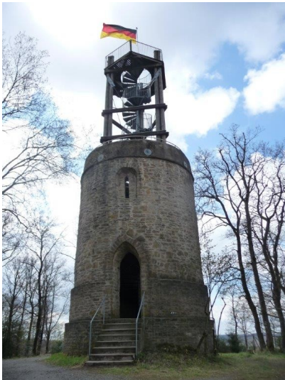
Aussichtsturm Hohe Warte (2014)