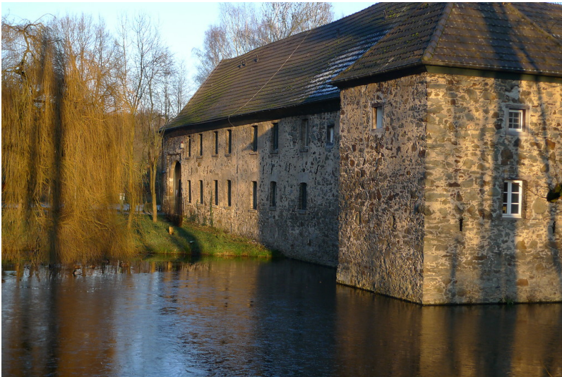
Wasserburg Haus Graven in Langenfeld-Wiescheid (2014)