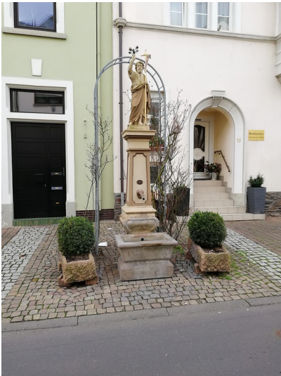
Der Johannesbrunnen in der Corraystraße in Zell an der Mosel (2019).