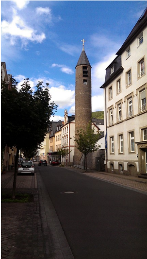
Blick von der Schloßstraße auf den Turm der Evangelischen Kirche in Zell (2015)