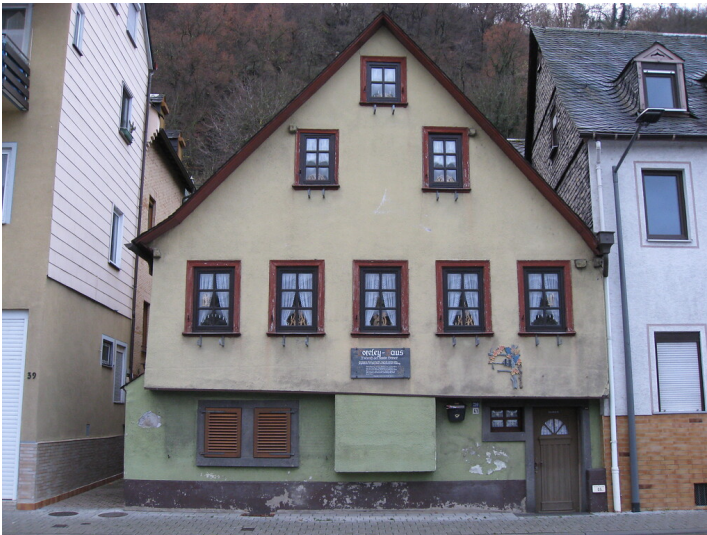
Loreleyhaus Sankt Goar (2015): Das ehemalige Fachwerkhaus aus dem 18. Jahrhundert ist heute verputzt.