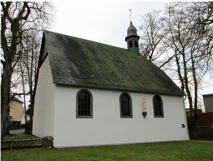
Die Waldkapelle in Kaisersesch, Ostseite von der Trierer Straße aus gesehen (2015).