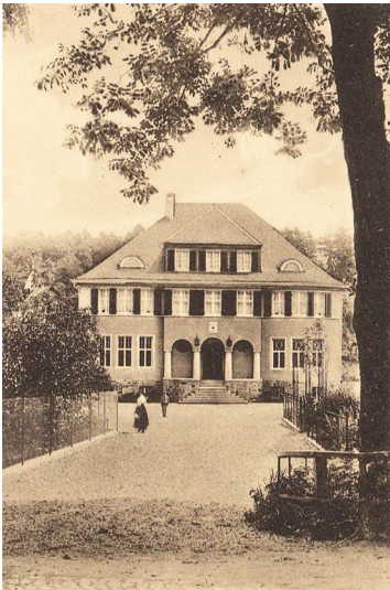
Altes Rathaus in Ründeroth