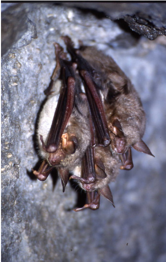
Fledermausart Großes Mausohr (2004)