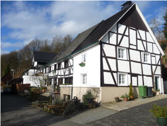
Fachwerkhaus in Alt-Stiefelhagen (2014)