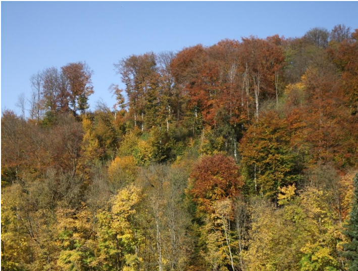
Naturschutzgebiet Weinberg, Runderoth (2012)