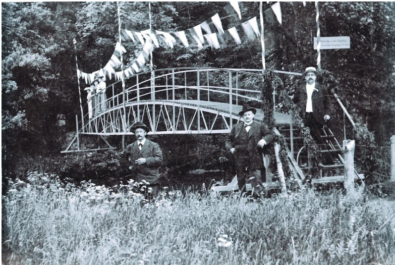
Wilhelmsbrücke in Ründeroth