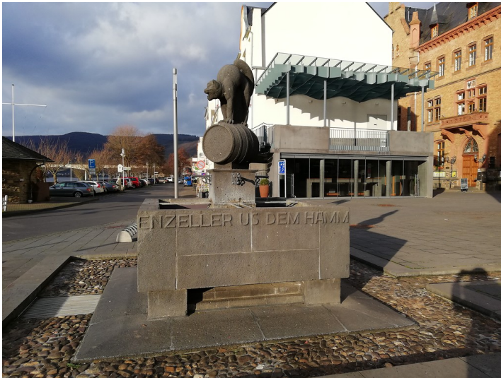
Brunnen Zeller Schwarze Katz auf dem Marktplatz in Zell an der Mosel (2019)