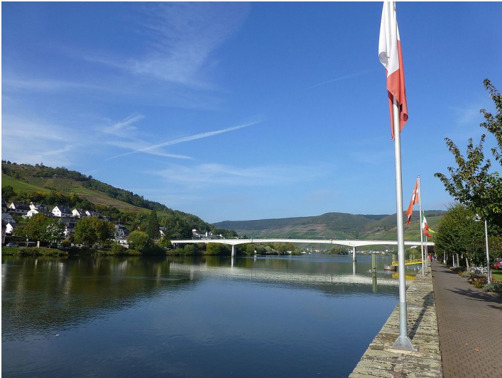
Blick auf die Straßenbrücke über die Mosel zwischen der Stadt Zell und dem Ortsteil Kaimt (2010)