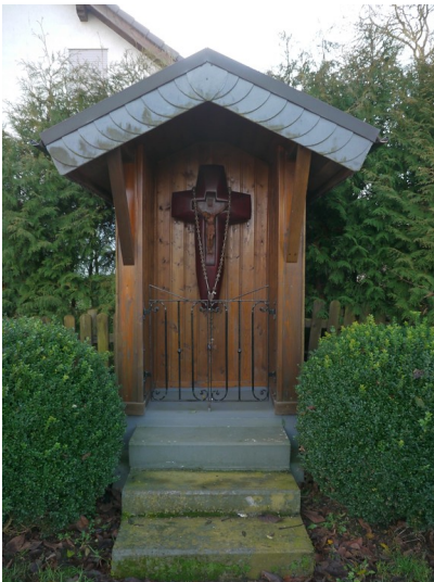
Wegekreuz in der "Nürsche" in Morsbach Lichtenberg (2015)